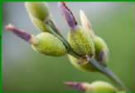
Пролетье 7 мая