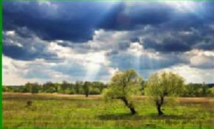
Овсень большой 6 мая