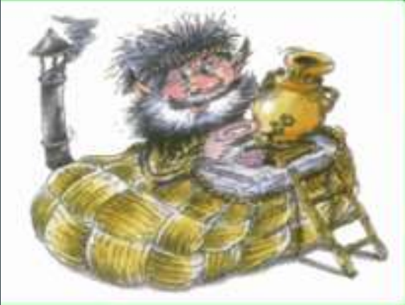
Именины домового 1 апреля